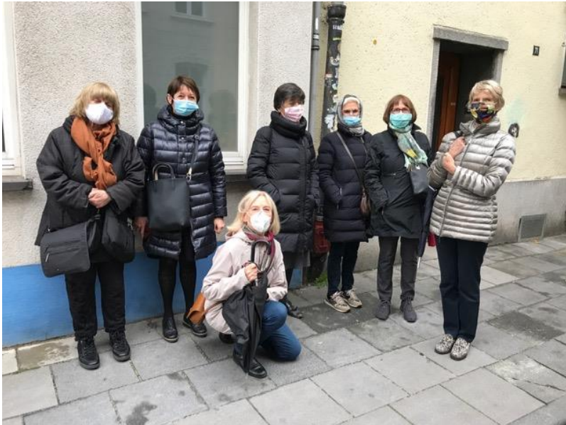
Photo prise à l'occasion de la visite « International Street Art » à Ehrendfeld

Vous avez entendu parler du Covid ?? Il est vrai que ce monstre bouleverse nos vies. Donc : chères amies, chers amis, adoptons un état d'esprit positif et dynamique. On nous recommande de nous aérer, et bien, malgré la saison, faisons front, sortons manteaux, bottes et bonnets...inscrivez-vous à nos propositions mais comme vous le savez, c'est le Covid qui dispose.