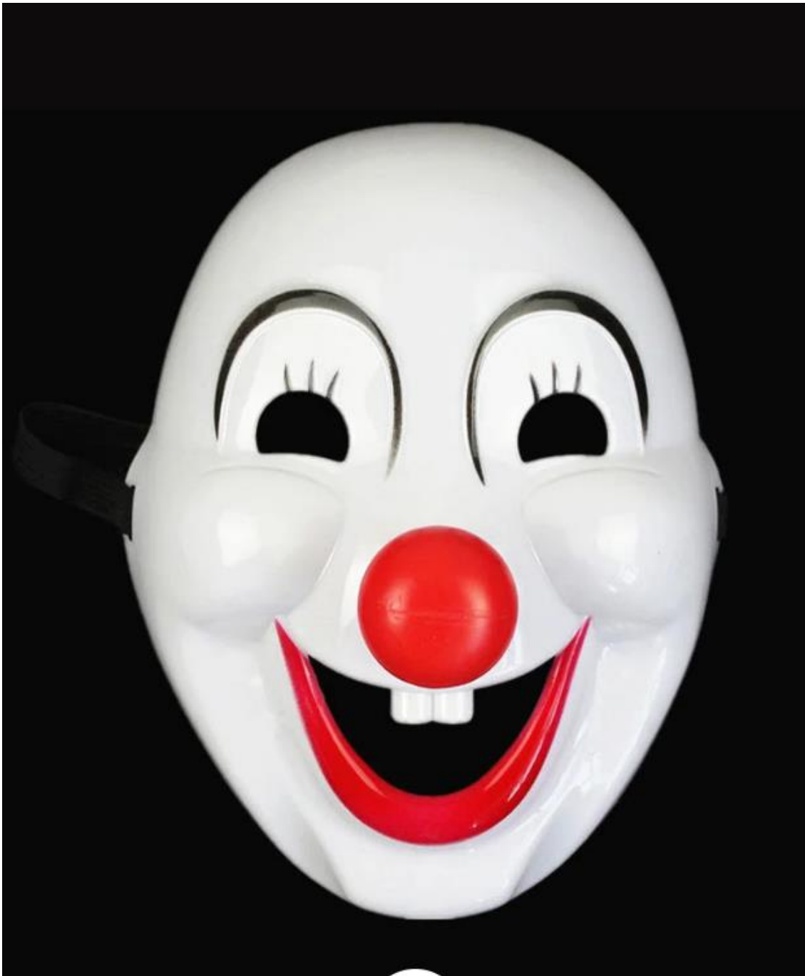
Kölner Karneval Clown Smile Kostüm Maske Weiss von Simpfit