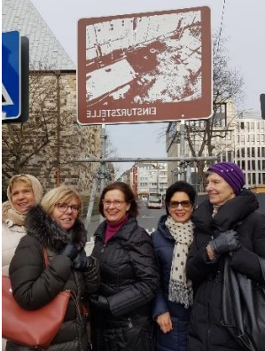
Visite des crèches (Cologne) - Kaffee-Kuchen à Meckenheim